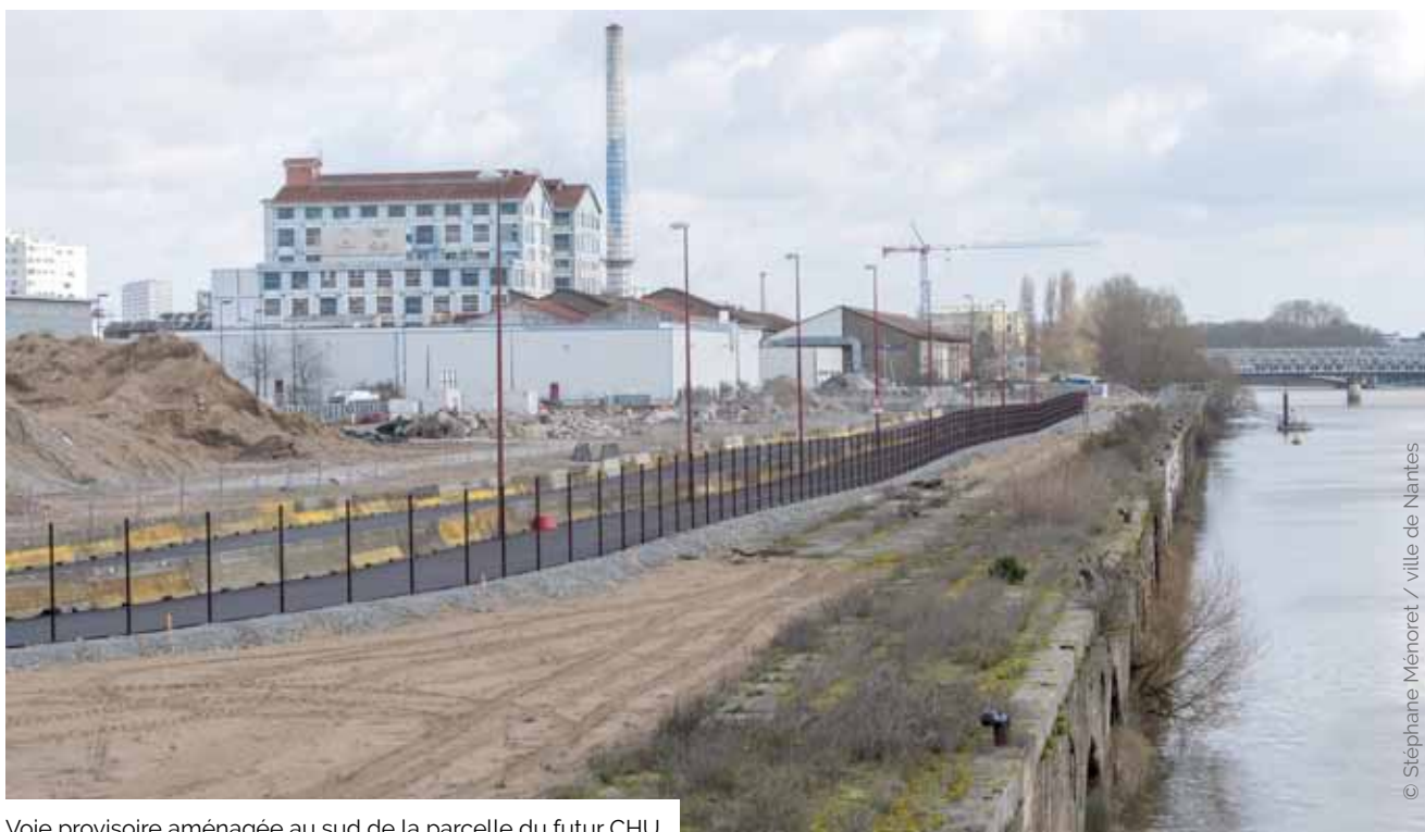
Voie provisoire aménagée au sud de la parcelle du futur CHU.