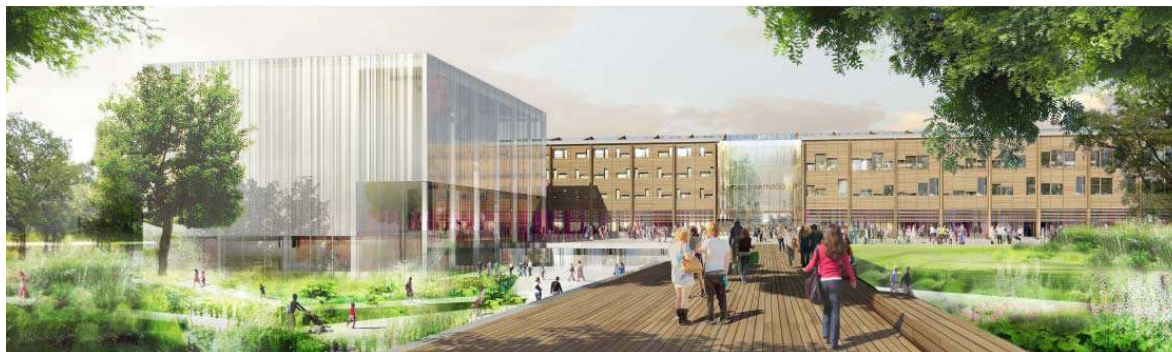
Entrée du lycée, accès parvis par la rue Gaëtan Rondeau