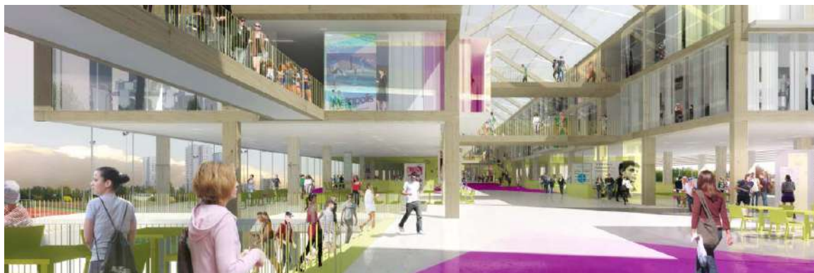
Rue centrale innervant le lycée