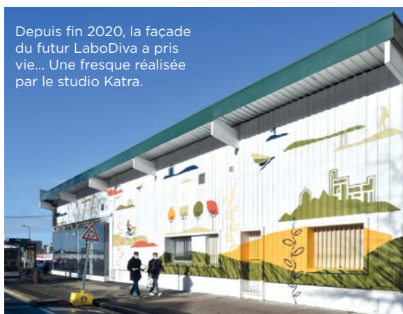
Depuis fin 2020, la façade du futur LaboDiva a pris vie... Une fresque réalisée par le studio Katra.