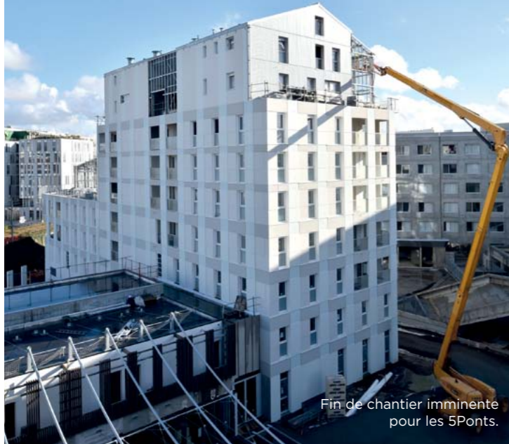
Fin de chantier imminente pour les 5Ponts.